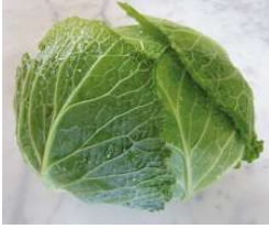
Chou Frisé (de Milan)