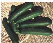
Vertes des Maraîchers

Précoce. Port dressé. Fruit en forme de massue d'environ 18 cm et de couleur vert foncé ligné de crème. Plante rustique naturellement résistante.