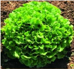
Feuille de chêne blonde

Batavia type pomme ouverte de présentation traditionnelle. Remplissage lent, bonne tenue au champ. Variété vigoureuse adaptée pour les conditions de printemps précoce et d'automne tardif. Bonne tolérance au Tip Burn.