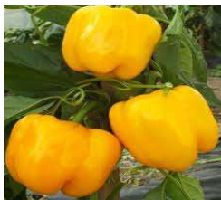
Quadrato d'astigiallo Jaune

Mi-précoce. Variété originaire d'Italie, très productive. Poivron carré à quatre lobes, tournant du vert au jaune d'or à maturité. Chair ferme, juteuse, d'une saveur douce et sucrée.