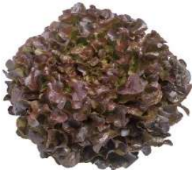
Feuille de chêne rouge

Bon comportement à la tâche orangée et au Pythium.